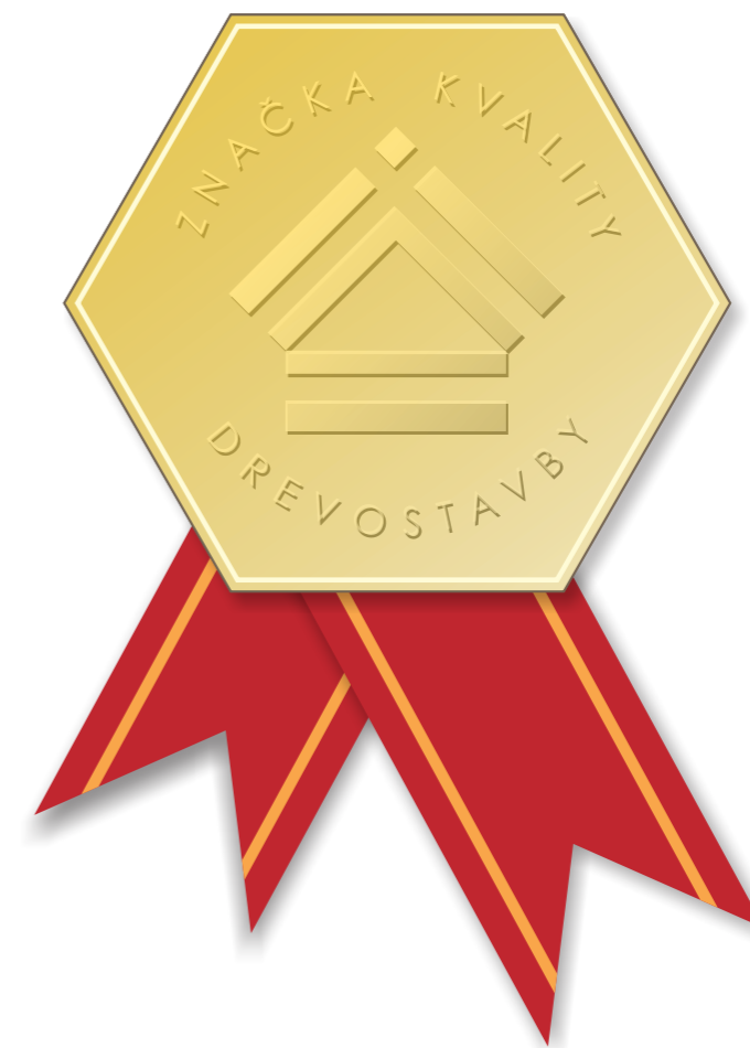
LOGO: Značka kvality drevostavby / forma zlatej pečate so stuhou

2.3) Blower-door test - min. 2x ročne preukázanie, že stavba, kde boli montované okná, prešla testom vzduchotesnosti podľa bodu II.1 a okná nevykazovali netesnosť vizuálnou kontrolou, termovíziou, dymovou skúškou alebo meraním prievzdušnosti.