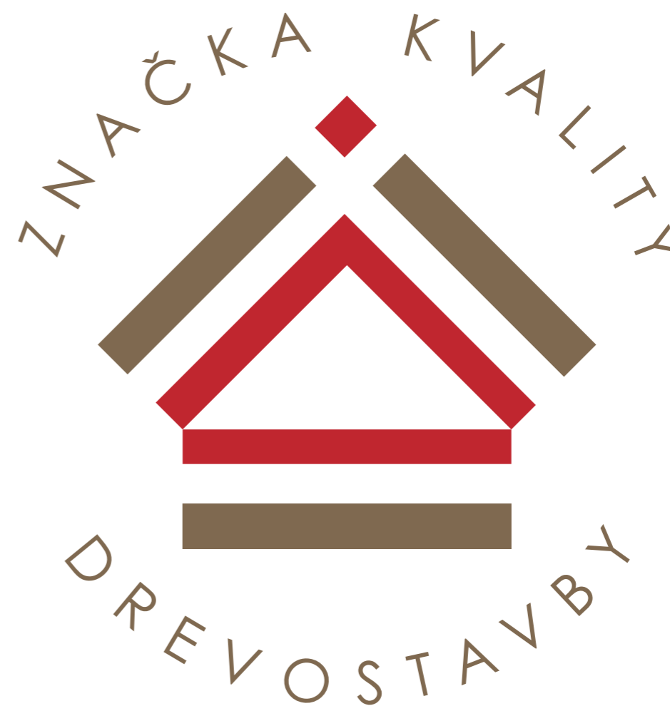
LOGO: Značka kvality drevostavby / základná forma loga s textom